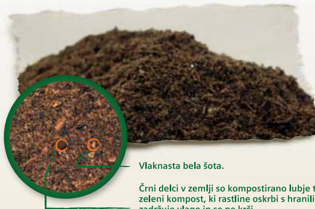
Vlaknasta bela šota.

Valentin zemlja vsebuje kvalitetno in manj razgrajeno vlaknasto belo šoto, ki je rjave barve in skrbi za zračnost in rahlo strukturo. Ne vsebuje veliko črne šote, saj ta zaradi svoje drobno mlete strukture povzroči zbitost zemlje, zastajanje vode