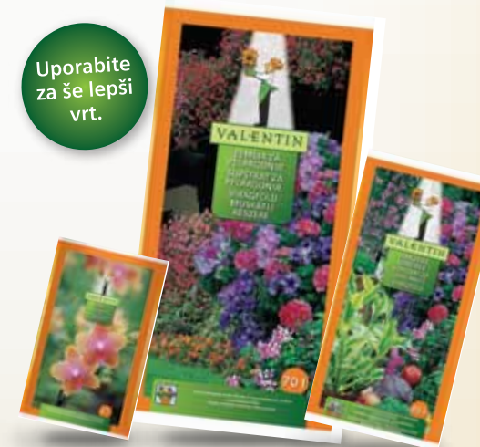
Valentin zemlja za orhideje 5 l, Valentin zemlja za pelargonije 70 l in Valentin zemlja za lončnice 45 l

Lončnice vam bodo pri presajanju najbolj hvaležne, če boste pripravili mešanico Valentin zemlje za lončnice in Valentin gnojila za balkonske rastline s podaljšanim delovanjem .