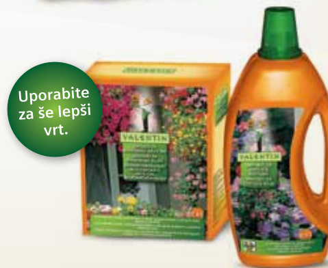
Valentin gnojilo z dolgotrajnim delovanjem za balkonske rastline 1 kg in Valentin gnojilo za cvetoče rastline 1l

Poskrbite, da bodo dalije odmaknjene od vročih sten in jim omogočite, da zrak okoli njih nemoteno kroži. Rastline bodo bolj zdrave, čvrste in vas bodo razveseljevale z zdravimi in barvitimi cvetovi.